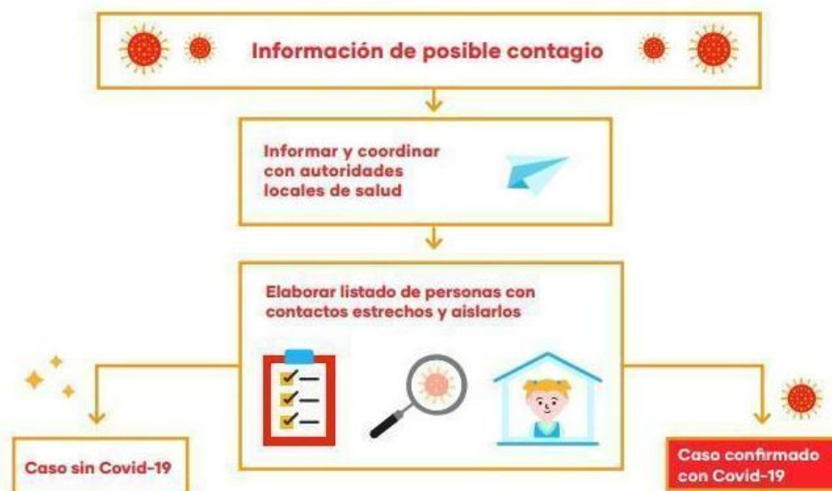
Figura 1: Flujograma de detección y primera respuesta en educación

El estudiante afectado sólo podrá reintegrarse a sus labores presentando certificado médico que acredite estar dado de alta o no ser portador de dicha enfermedad.