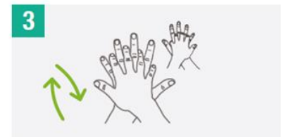
Frotar palma derecha sobre dorso izquierdo con dedos entrelazados y viceversa