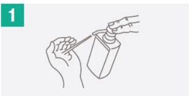
Aplicar una porción generosa en la mano formando un hueco para cubrir la mayor área posible