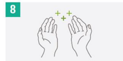
Una vez secas, las manos están desinfectadas