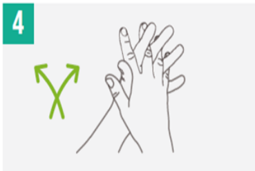
Frotar palma con palma con dedos entrelazados