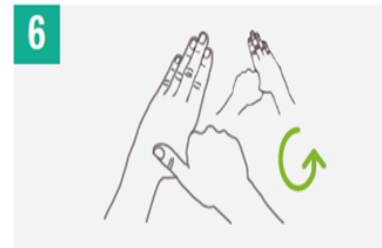
Frotar rotacionalmente el pulgar izquierdo en la palma derecha y viceversa