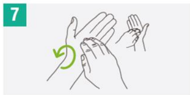
Frotar de manera rotacional, en ambos sentidos, con los dedos juntos y la mano derecha en la palma izquierda y viceversa